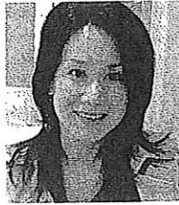
NPO法人WANA関西 代表理事